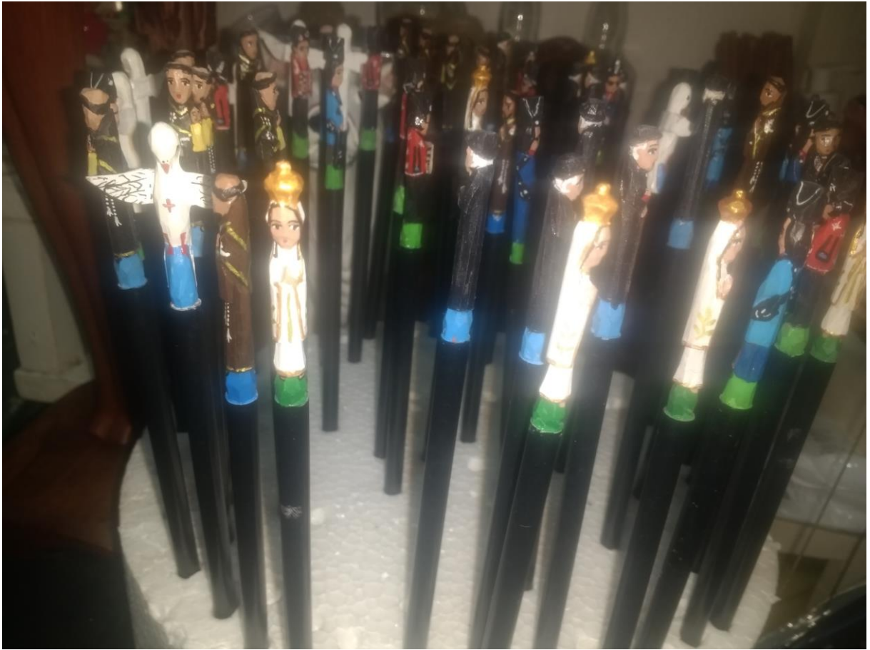
Lápis com figuras religiosas cristãs