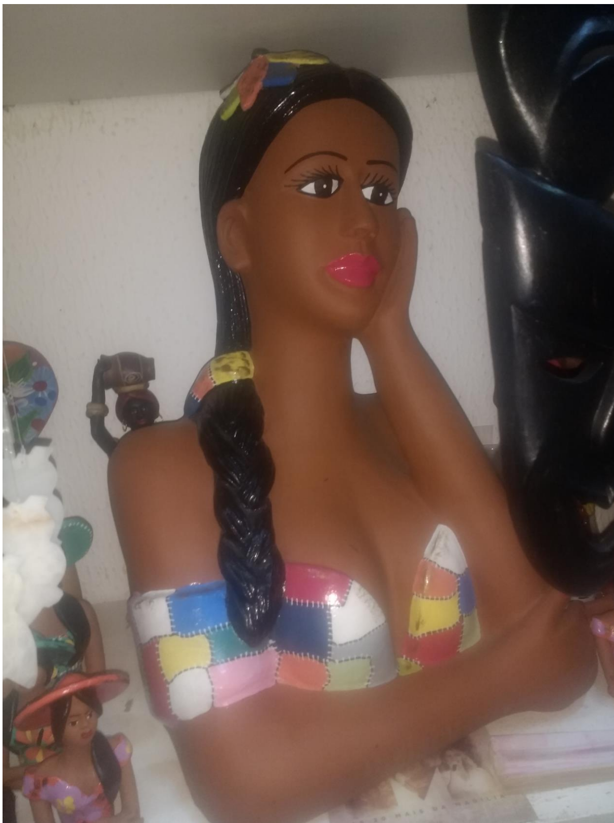
As bonecas de barro estão bastante presentes nos boxes do mercado