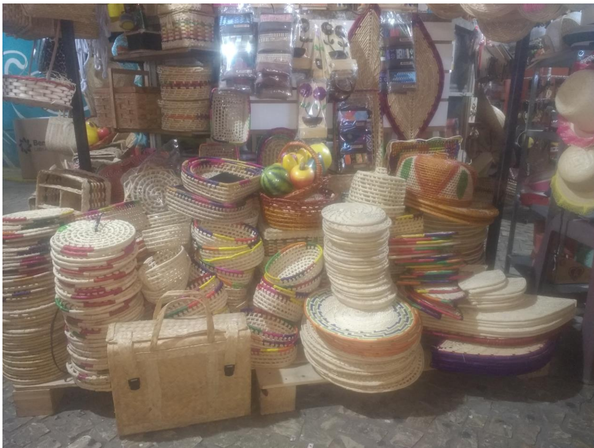
Produtos feitos com palha